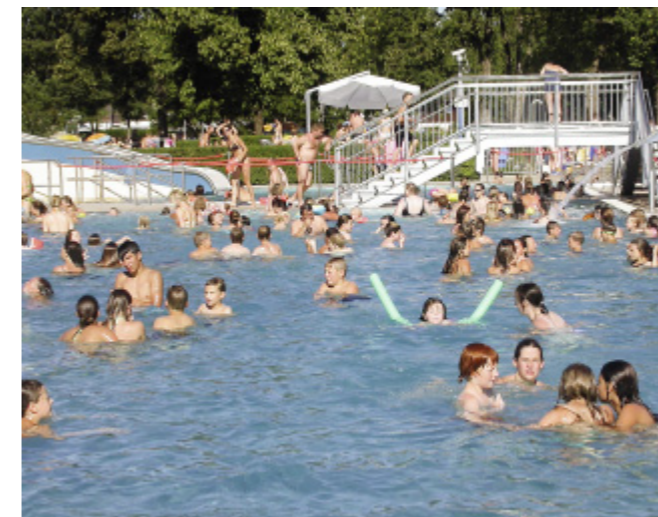
Wellnessbecken mit Rutsche

Sa., So. und Feiertage 9.00 bis 20.00 Uhr