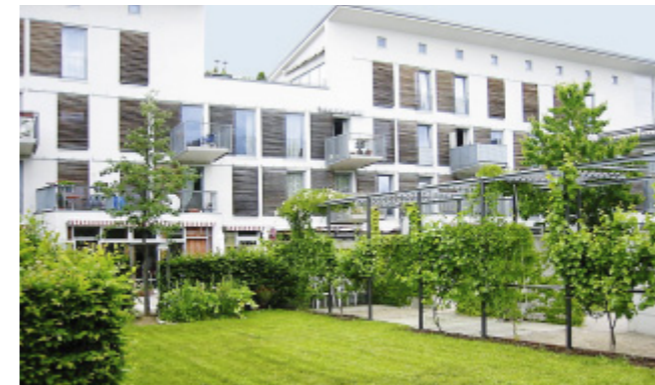
Die Gartenfassade des Betreuten Wohnen der AWO.

Das Leben im „Betreuten Wohnen“ orientiert sich an den Merkmalen eines selbstständigen und selbstbestimmten Wohnens. Die Einrichtung unterstützt dieses Anliegen durch seine baulichen Voraussetzungen, eine entsprechende Beratung und Hilfestellung, durch eine Betreuungskraft vor Ort und die Vermittlung externer und interner Dienste. Ein separater Betreuungsvertrag zum Mietvertrag regelt diese zusätzlichen Dienst- und Serviceleistungen. Hierdurch kann die Sicherheit und die notwendige Versorgung, in den oft schwierigen altersbedingten bzw. gesundheitlichen Lebenssituationen, in den meisten Fällen gewährleistet werden. Des Weiteren bietet die Anlage verschiedene Gemeinschaftsräume, die von den Mietern für die unterschiedlichen Aktivitäten und Veranstaltungen genutzt werden können. Ein breit gefächertes Angebot macht hier gesellschaftliches Beisammensein möglich und kann für Abwechslung im Alltag sorgen. Der Standort in 10-Minuten-Entfernung zur S-Bahn und zum Ortszentrum schafft die beste Voraussetzung für ein aktives Leben in der Gemeinde. Einkaufsmöglichkeiten, Seniorenclub, Sport- und Freizeitpark, Bürgerhaus und Kirche befinden sich in erreichbarer Nähe. In die Wohnanlage integriert ist die Tagespflege der Nachbarschaftshilfe .