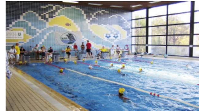
24-Stunden-Schwimmen der DLRG im Jagdfeldbad