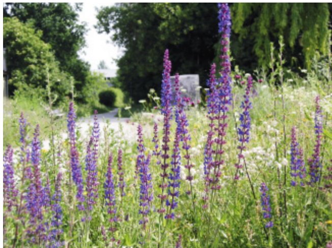
Salbei-Kolonie am alten Industriegleis

Wer gerne spazieren geht, kommt schnell ins Grüne. Die Gemeinde unterhält Grünanlagen am Wieselweg, am Waldfriedhof, am Sport- und Freizeitpark, an der Parkstraße und in Gronsdorf in Verbindung mit dem Landschaftspark Riem. Die Pflege übernehmen der Bauhof und die Hausmeister der jeweiligen Einrichtungen. Der Park zwischen Rathaus und Maria-Stadler-Haus ist Haars kleiner „Botanischer Garten“. Je nach Jahreszeit blühen dort verschiedene Stauden und Gewächse, zur Freude der Bewohner des Maria-Stadler-Hauses und der Spaziergänger.