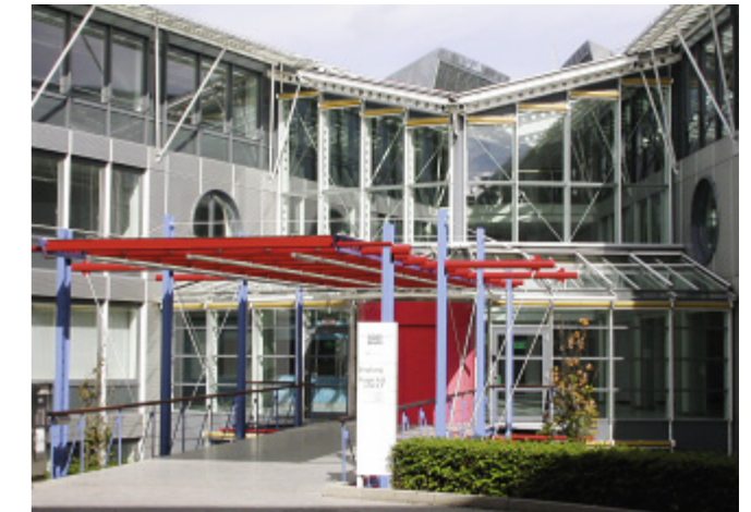
Bürogebäude an der Richard-Reitzner-Allee

Die rund 2.100 Gewerbebetriebe in Haar sind vornehmlich auf dem Dienstleistungssektor tätig. Die Gewerbesteuererinnahmen lagen 2007 bei 22 Mio. Euro. Sie sind die größte gemeindliche Einnahmequelle und dienen dem Gemeinderat maßgeblich als Planungsgrundlage für künftige Investitionen.