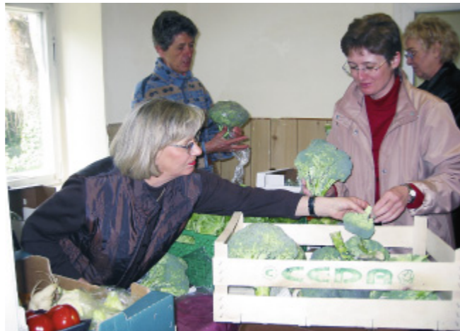
Helferinnen sortieren die von Haarer Geschäften gespendeten Waren.