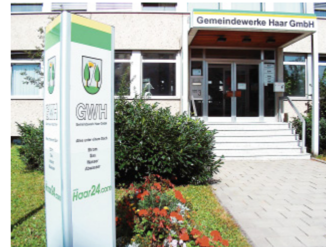
Der Energieversorger vor Ort. Das Firmengebäude der GWH in der Blumenstraße.

Die Gemeindewerke versorgen die Haarer Bürgerinnen und Bürger mit >Trinkwasser und stellen Löschwasser bereit. Darüber hinaus sind sie als Dachunternehmen mit den Sparten Stromversorgung , Gasversorgung und Abwasserbeseitigung für alle Fragen der Ver- und Entsorgung die erste Adresse in Haar.