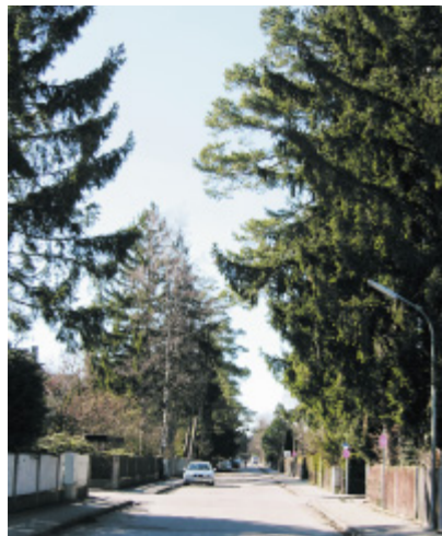
Die Zunftstraße: Musterbeispiel für eine von Grobbäumen geprägte Wohnstraße.

Die Haarer Baumschutzverordnung wurde 2002 vom Gemeinderat in neuer Fassung beschlossen, um die innerörtliche Begrünung zu erhalten. Schließlich prägen Bäume und Sträucher das Ortsbild sehr stark und sorgen für eine höhere Lebensqualität. Gleichzeitig leisten sie einen wesentlichen Beitrag zur Verbesserung der Haarer Luft. Sie bieten außerdem Lebensraum für die verschiedensten Tierarten und helfen auch so, das Gleichgewicht in der Natur zu erhalten.