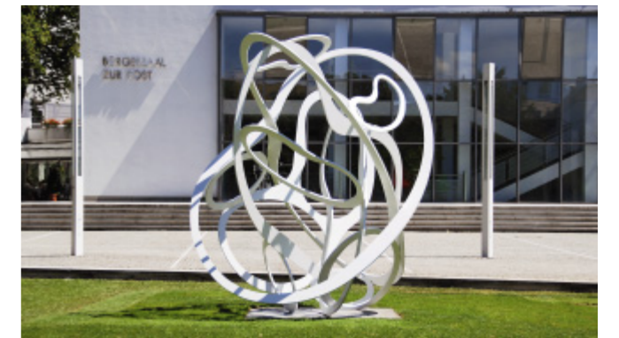
Werner Mallys Skulptur „Bewegte Sphäre“ vor dem Bürgerhaus

Das im Oktober 1990 der Öffentlichkeit übergebene Bürgerhaus mit seinem „Bürgersaal zur Post“ kann mit etwa 290 Veranstaltungen im Jahr mit Recht darauf hinweisen, dass es sich nicht nur bei den örtlichen Vereinen und Organisationen, sondern auch darüber hinaus im weiteren Umfeld einen guten Namen gemacht hat. Der Saal bietet zusammen mit der Galerie Platz für 500 bis 570 Besucher. Er verfügt über eine Bühne und über ein weitläufiges Foyer, das sehr gerne für Empfänge und/oder Buffets genutzt wird. In den drei für Haarer Vereine und Institutionen zur Verfügung gestellten Räumen herrscht täglich Hochbetrieb. Vormittags werden zwischen 4 bis 6 Sprachkurse der Volkshochschule Haar abgehalten und abends finden regelmäßige Treffen der Vereine statt. Sehr beliebt sind die Spiele- und Schachabende.